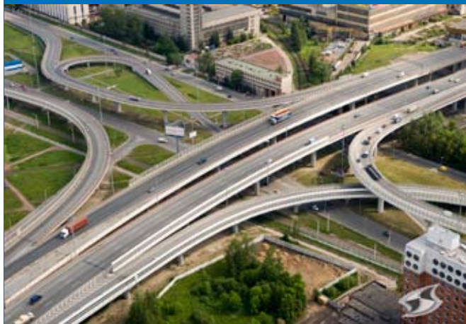
Развязка КАД с проспектом Обуховской Обороны

Группа предприятий «Дорсервис» имеет 18 филиалов в Северо-Западном, Центральном, Южном федеральных округах и в Республике Абхазия.