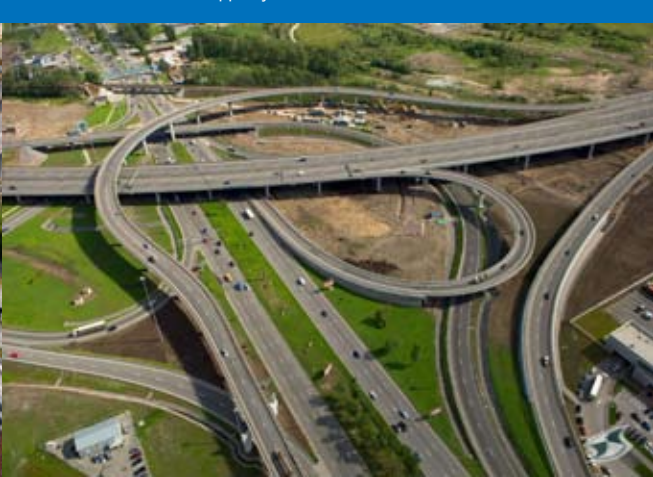
Развязка КАД с Пулковским шоссе

Группа предприятий «Дорсервис» 195248 Санкт-Петербург, ул. Бокситогорская, 9 Телефон: (812) 325-91-62 Факс: 325-91-60 E-mail: mail@dor.spb.ru www.dor.spb.ru